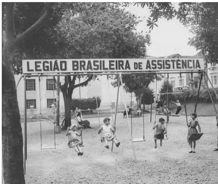
Figura 2- Parques Infantis da Legião de Assistência, Curitiba, 1977.